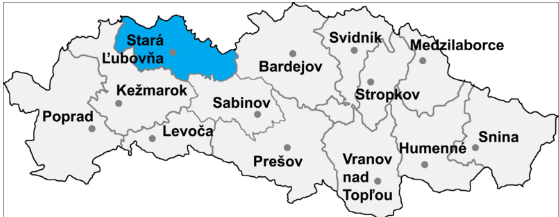
Umiestnenie okresu Stará Ľubovňa v rámci Prešovského kraja (zdroj: sk.wikipedia.org)

Cesty II. triedy: 20,787 km Cesty III. triedy: 138,639 km (zdroj: sk.wikipedia.org)