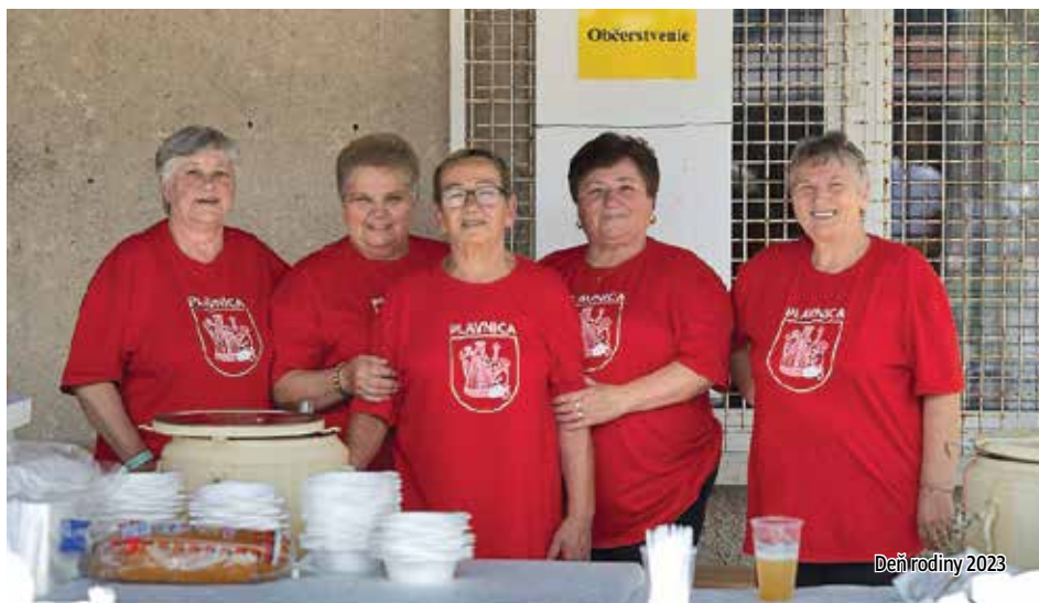
Deň rodiny 2023

Naším seniorom a seniorkám želim pevné zdravie a za všetky aktivity pri zveľadovaní obce im patrí veľké ďakujem.