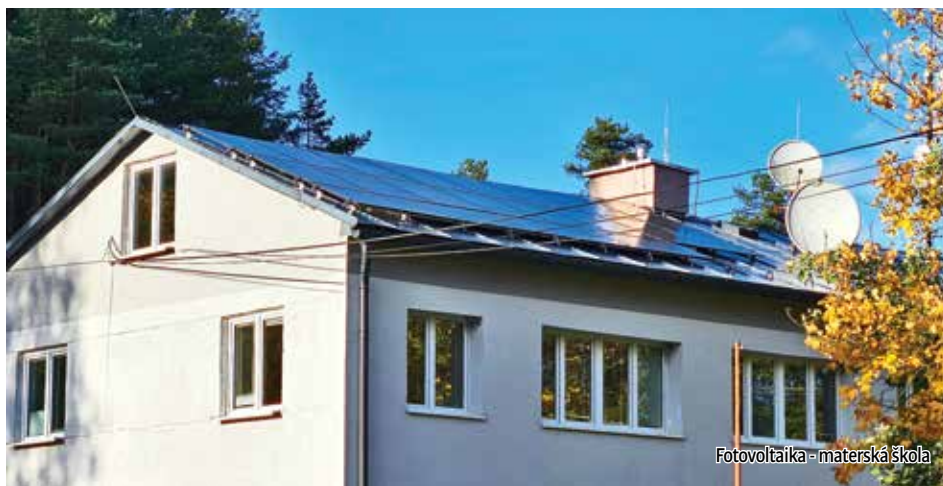
Fotovoltaika - materská škola