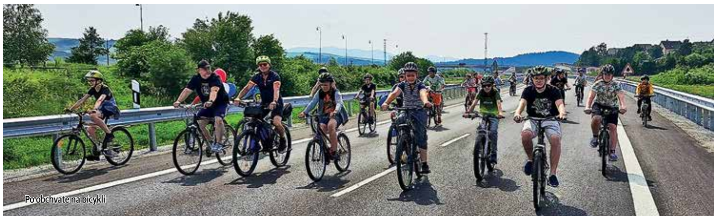
Po obchvate na bicykli

V každom z nás v decembri ožije tešaie sa dieťa. Veď práve deti si tento čas vychutnávali najviac. Nielen doma v rodinách, ale aj v škole počas celého decembra vládla sviačočná nálada. Naša škola sa zázračne zmenila na veľkú tvorivú dielňu. Zrazu mali všetci plné ruky práce, maľovali, zdobili, nacvičovali, spievali, tancovali... a všetci sa tešili na vianočné prázdniny. A tu uzatvárame kapitolu roka 2023. Pred nami je nový rok, plný nových príbehov a výziev a my sa tešíme na to, čo nám prinesie.