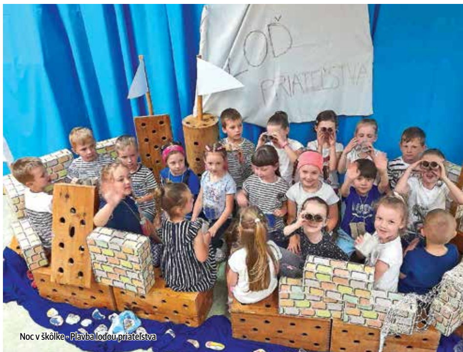
Noc v škôlke - Plavba lodou priateľstva