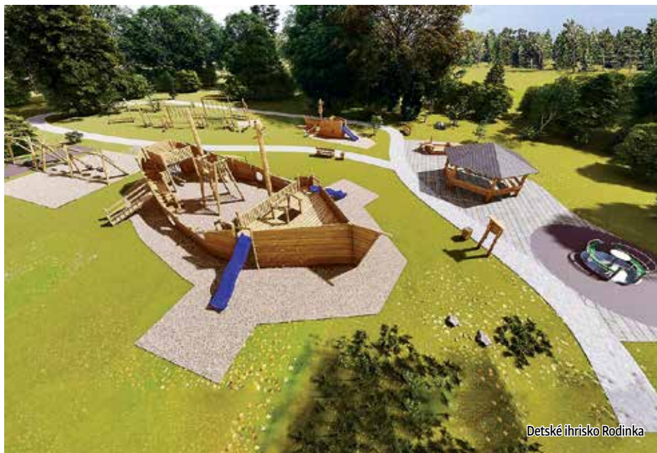
Detské ihrisko Rodinka

Už začiatkom januára 2024 ste si mohli v krátkom videu pozrieť projekty, ktoré boli zrealizované alebo sa ich realizácia začala.