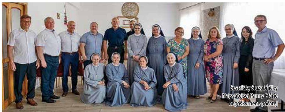
Sestričky Služobníčky Najsvätejšej Panny Márie nepoškvrnene počatej