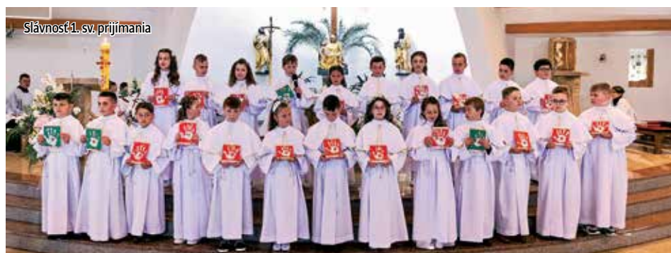
Slávnosť 1. sv. prijímania