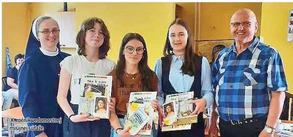
X. ročník vedomostnej misijnej súťaže