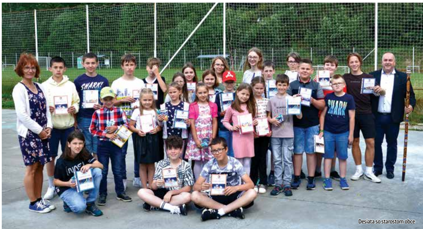
Desiata so starostom obce

Pred ukončením školského roka sa každoročne koná desiata so starostom obce, kde sú pozvaní najúspešnejší žiaci, ktorí reprezentujú nielen školu, ale aj obec v rôznych