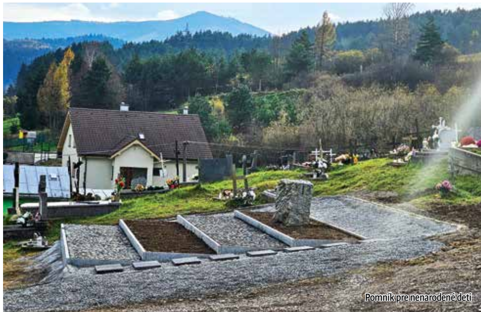
Pomník pre nenarodené deti

Video je zverejnené nielen na obcej stránke, ale aj na YouTube kanáli obce Plavnica.