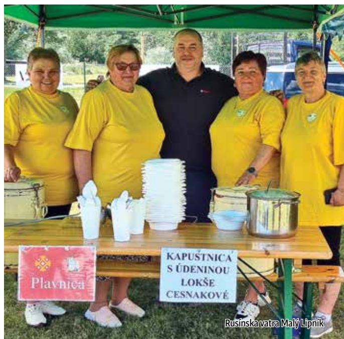
Rusínska vatra Malý Lipník