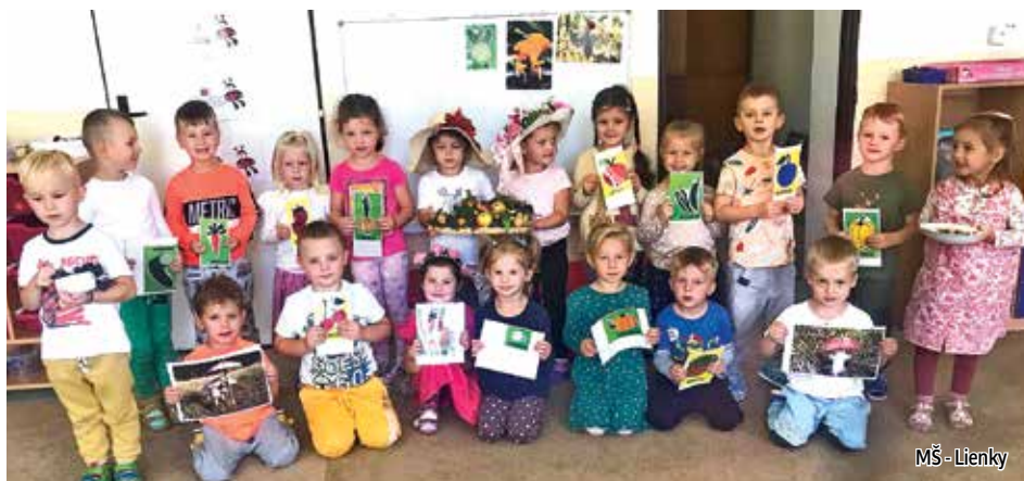
MŠ - Lienky

Ako každý rok, aj tento rok k nám prišiel Mikuláš, ktorý bol veľmi štedrý. Priniesol deťom mikulášsky balíček s malým prekvením pre zdravie zubkov. Vianoce bolo cítiť doslovne po upečení medovníčkov, kedy si deti vyskúšali valkať medové cesto, vykrajovať formičkami. Na hotových medovníčkoch, obličkách s medom a jablčkom si mohli deti pochutnať počas Štedrej večere v materskej škole. Realizovali sme sa aj pri výrobe vianočných ozdôb, ikebán a dekorácií na vianočné trhy. Aj rodičia, starí rodičia a učiteľky tvorivými a šikovnými rukami obohatili trhy svojimi výrobkami. Svoju radosť z posledného ročného obdobia sme preniesli do rozbaľovania darčiekov pod vianočným stromčekom. Tešili sme sa